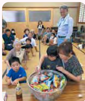
<御殿にここにこ会>

夏に有志の協力で竹等の準備をして「七夕」、「そうめん流し」や「お玉でお菓子救いゲーム」をしました。久しぶりのイベントで子ども大人も笑顔いっぱいの楽しいサロン会になり、みんなの絆も深まりました。