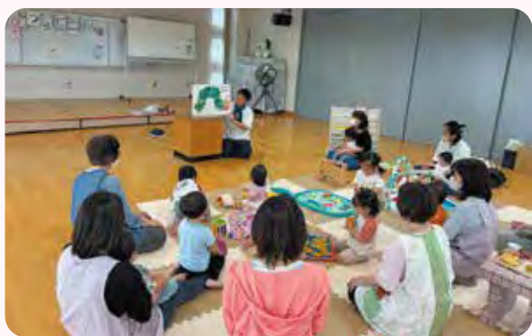
弦打保育所出前保育

“おやこDEつるピー広場”は、地域のボランティアの皆さんに見守られながら、みんなでわいわい楽しい時間を過ごす親子ふれあい広場です！令和6年度は地元の保育所や幼稚園とのコラボのイベントや出前保育なども増え、盛りだくさんの内容で開催しました♪