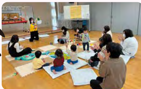
さくらの杜保育園出前保育園