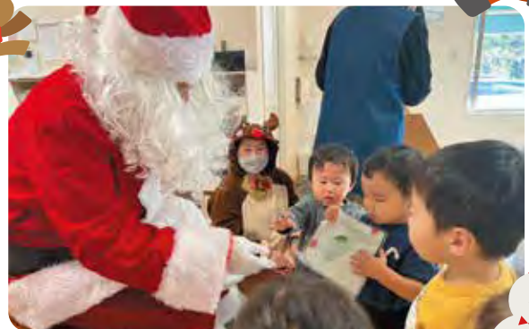
さくらの杜保育園