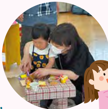
～楽しくおままごと♪～