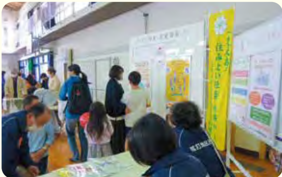
<民生委員児童委員協議会>

地域の皆様に、児童虐待・DV防止への理解を深めて頂くため、弦打地区文化祭において、パネル展示やチラシの配布などを行いました。